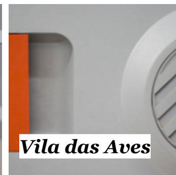
Vila das Aves